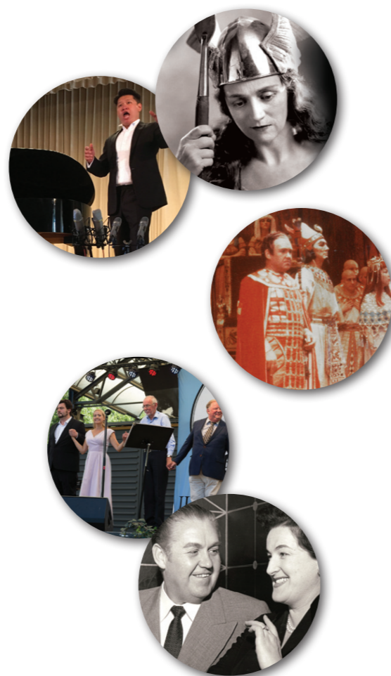
Omslag: Jussi vid mikrofonen