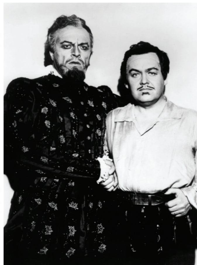
Boris Christoff och Jussi i Don Carlos den 30 november 1957.