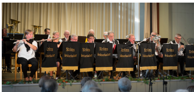
Konserten inleddes av charmiga Ströms Bruksorkester.