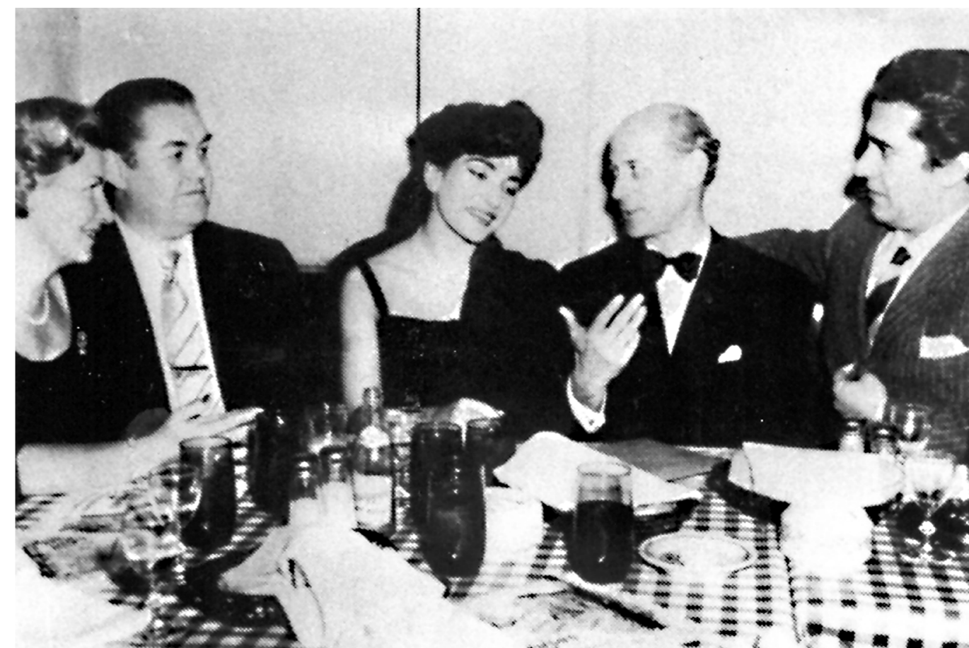
Anna-Lisa och Jussi tillsammans med Maria Callas, Rudolf Bing och Giuseppe di Stefano i Chicago den 8 november 1955.

Det var som Manrico i Trubaduren, som Björling gjorde sin debut den 5 november 1955. Hans Leonora var Maria Callas, som återkom till sin andra säsong där. Den här föreställningen och en andra den 8 november blev de enda gångerna de någonsin sjöng tillsammans. Med Nicola Rescigno på pulsten ingick Ebe Stignani och Ettore Bastianini (ersatta av Claramae Turner och Robert Weede vid den andra föreställningen). Om den första föreställningen skrev den inflytelserika musikkritikern