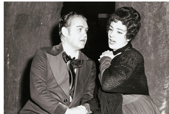
Jussi och Anna Moffo i La bohème den 16 oktober 1957.