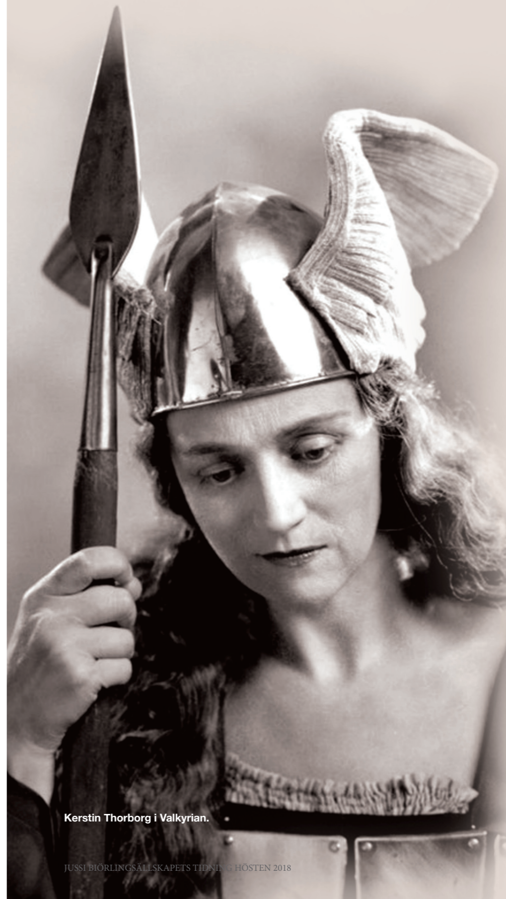
Kerstin Thorborg i Valkyrian.