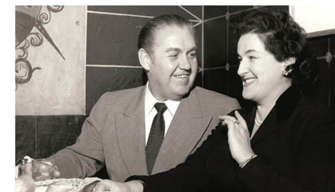
Jussi Björling och Birgit Nilsson tillsammans på restaurang.

Jag satt egentligen väldigt illa till, men man sa förstås inte nej när Birgit Nilsson bad en komma, så naturligtvis var jag där på en kvart. Så gjorde vi intervjun på hennes rum, och det var lika trevligt som vanligt, och när den var slut, ville Birgit bjuda på en kopp kaffe, så vi gick ner i matsalen närmast entrédörren. Så bad Birgit servitrisen om två kaffe. – Nej, vi har inte kaffe, fick hon då till svar. – Va! Har ni inget kaffe! utbrast en förbluffad Birgit. – Nej, det här är ett tea-room, svarade den rätt oförskämda servitrisen högdraget. – Ja, här har jag farit jorden runt flera gånger, men aldrig har jag då träffat på, att man inte har haft något kaffe, sa den besvikna Birgit Nilsson, när vi satt där och sörplade te istället.